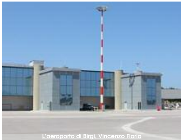
L'aeroporto di Birgi, Vincenzo Florio

L'imprenditore Oddo: "E' tempo di cambiare"