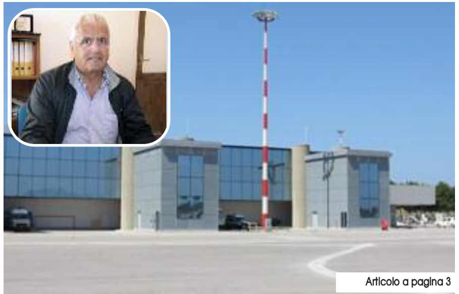
Articolo a pagina 3